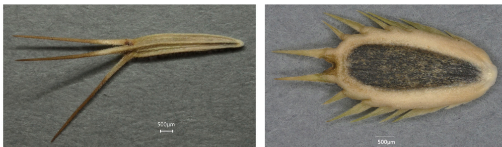
Figure 1. Akènes des fleurons centraux (à gauche) et des fleurons périphériques (à droite) de Synedrella nodiflora — Achenes of Synedrella nodiflora central floret (left) and peripheral floret (right) .

Le portail WIKTROP de partage de connaissances sur les adventices tropicales a permis d'obtenir une description des fruits (capsules, gousses, etc.) et des semences des différentes espèces, de façon à inventorier les caractéristiques des différentes espèces étudiées. Par exemple, Commelina benghalensis L. peut produire des fruits aériens et des fruits souterrains et, dans chaque fruit, produire deux types de semences. Certaines espèces de la famille des Asteraceae ont une inflorescence en capitule constituée de fleurons de formes différentes produisant des semences de formes différentes. C'est le cas par exemple d'espèces comme Bidens pilosa L. et Synedrella nodiflora (L.) Gaertn. ( Figure 1 ).