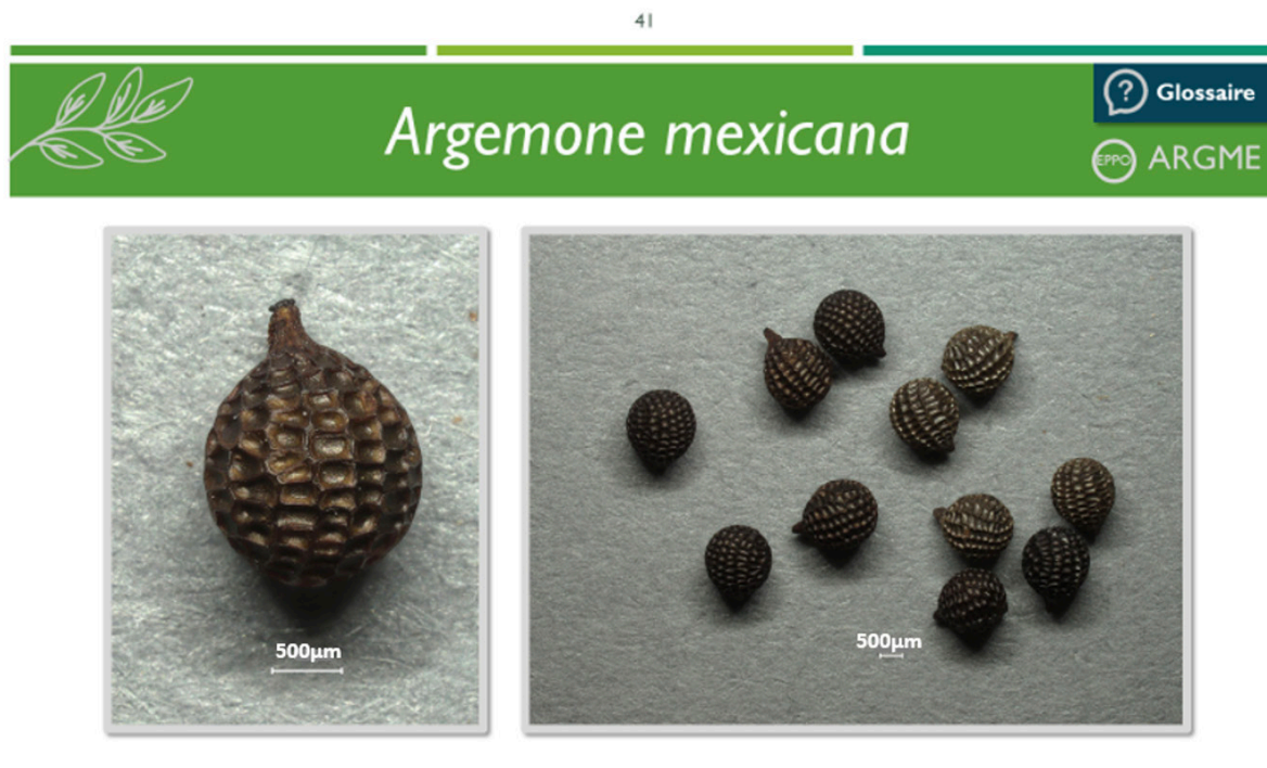
Figure 4. Exemple de la fiche descriptive de la semence d' Argemone mexicana L. ( a. première page, b. deuxième page) — Example of the Argemone mexicana L. seed description sheet ( a. first page, b. second page).

variable en fonction des sous-groupes constitués. Il est désormais aisé d'intégrer de nouvelles espèces dans cette clé, au fur et à mesure de leur caractérisation, en utilisant les modalités de caractères existantes ou en ajoutant de nouvelles modalités de caractères si nécessaire.