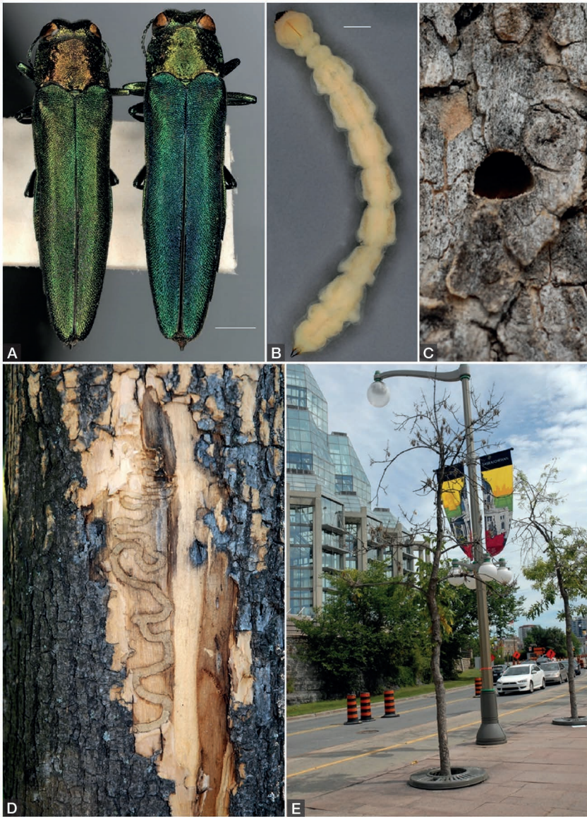
Figure 8.1. A. planipennis : A) habitus mâle et femelle; B) larve; C) trou de sortie en D; D) trace de galerie larvaire sous-corticale; E) dégâts sur arbres d'alignement à Ottawa.

Plusieurs particularités du cycle biologique de cet insecte sont importantes pour estimer le risque d'entrée, d'établissement, puis de dissémination en France et plus généralement en Europe, ainsi que pour optimiser les mesures de surveillance. Les femelles fécondées pondent dans les fissures des écorces des arbres hôtes. Les œufs éclosent dans les deux semaines suivant la ponte, et les larves du premier stade pénètrent dans l'écorce et se nourrissent du phloème et du cambium, muant trois fois jusqu'à ce qu'elles atteignent le quatrième stade, puis creusent 1 à 2 cm plus